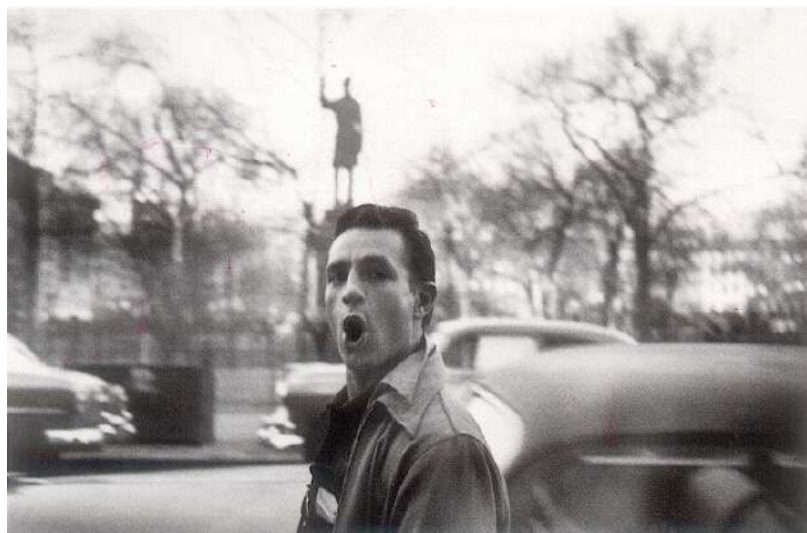
Photo Allen Ginsberg - Jack Kerouac errant dans la East 7th Street

Aborder Futurs par la question du droit permet d'arrimer le futur au présent et de faire apparaître des mythes et une histoire commune. La notion est suffisamment forte pour inspirer des projets à l'échelle européenne et mondiale. Peut-être aide-t-elle à faire réaliser une vérité dérangement : que nous avons colonisé le futur. Le droit des générations futures est le droit de l'humanité présente et future ancrée dans un vivant qui possède sa propre valeur.